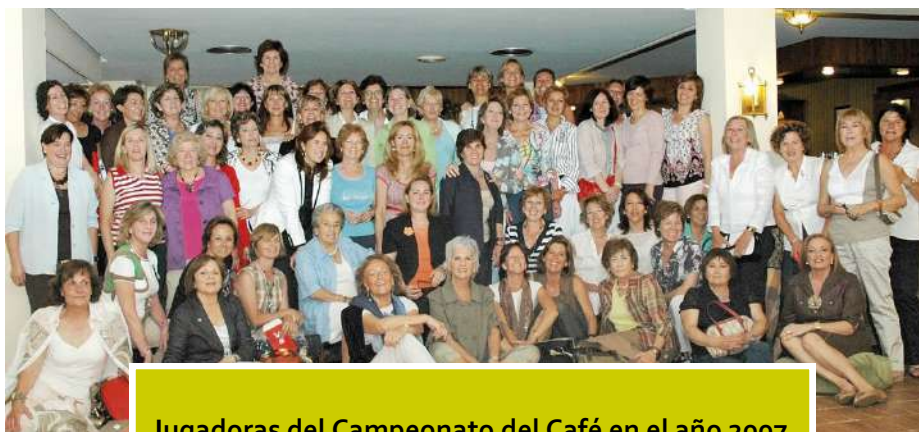
Jugadoras del Campeonato del Café en el año 2007

Fue en uno de estos amigables encuentros cuando surgió una idea que, más de cuarenta años después, perdura en el tiempo: organizar un torneo de tenis entre socias, mezclando jugadoras de más nivel con otras de iniciación.