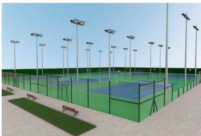
Simulación de cómo quedarían las pistas de entrenamiento de tenis una vez reformadas