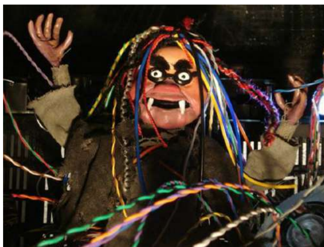
La Bruja Avería haciendo de las suyas

10:15 h. Llega la excavadora. Ahondamos bocado a bocado, tres metros de profundidad más tarde encontramos una capa de limo, señal