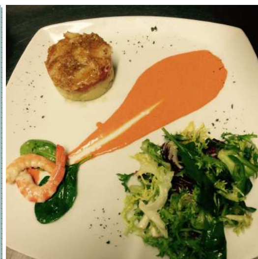
Presentación final del delicioso timbal de bacalao y langostinos