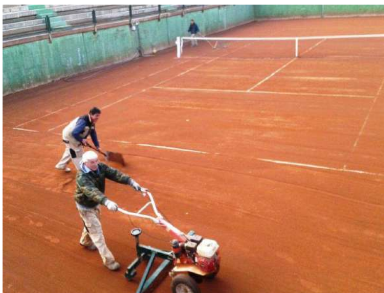
Preparando una de las pistas hundidas

Aquel día, en el que alguien supuso que jugar a tenis en tierra batida podría ser una buena idea, sin duda, las musas fueron a visitarle en tropel.