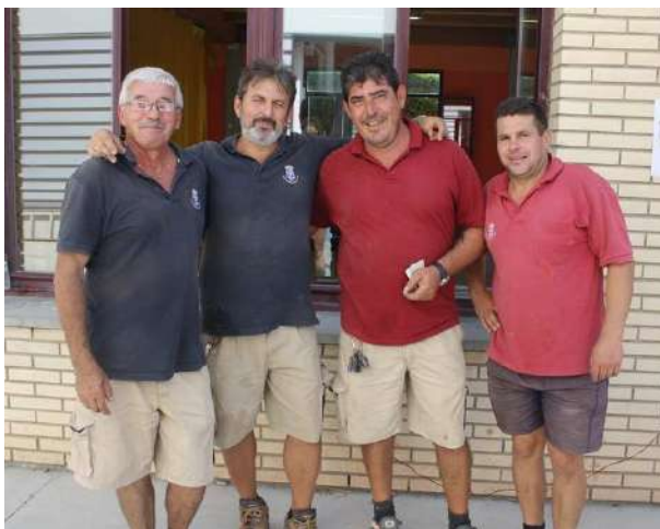
Parte del equipo de mantenimiento del Club

Este escenario produce en los trabajadores una fatiga física y mental provocada por la exigencia de un rendimiento muy superior al normal, y